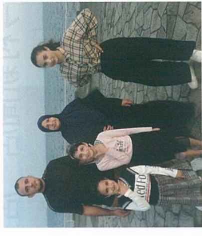
ジャムールさんは難民キャンプから家族を呼び日本で生活している